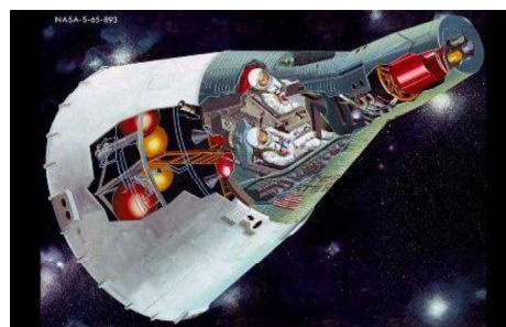
Cápsula Gemini.

El programa Gemini debe su nombre a la cápsula diseñada para alojar a dos astronautas.