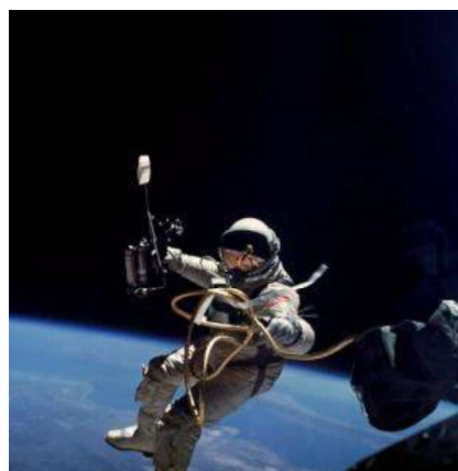
White durante su paseo espacial.