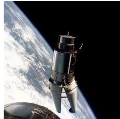
Nave Agena con las compuertas sin abrir.

Geminis VIII. Tripulación formada por Armstrong y Scott. En esta misión se produjo un incidente en el acoplamiento con la cápsula Agena que ocasionó que la nave Gemini iniciara un giro sobre su eje longitudinal que estuvo a punto de producir la destrucción de la misma. La habilidad y nervios de acero de un novato Armstrong permitieron recuperar la estabilidad de la nave utilizando los cohetes de reentrada.