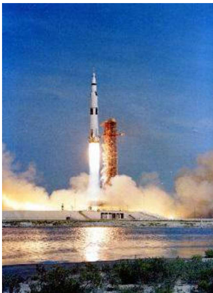
Despegue del Apolo XI.