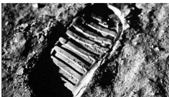
Huella sobre la superficie lunar.

Un reto enorme, sin precedentes de: ingeniería, informática, nuevos combustibles, mecánica espacial, diseño de trayectorias, coordinación de empresas, logística, nuevos materiales, medicina, arquitectura civil... más de 400.000 personas y 20.000 empresas contratistas.