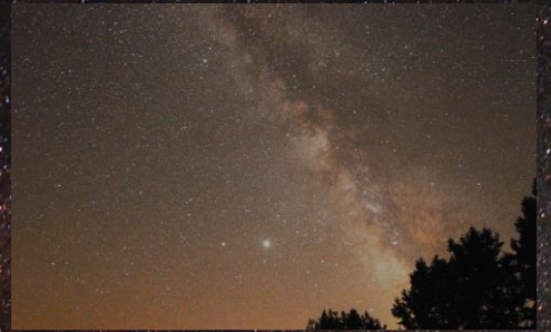
Vía Láctea con Júpiter y Saturno